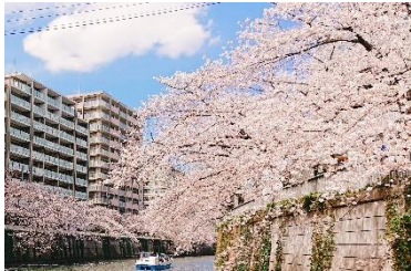
目黒川桜クルーズ (イメージ)

都内の桜名所をクルーズとオープントップバスでめぐる贅沢なコース！ ちょっと贅沢に春を感じてみませんか？