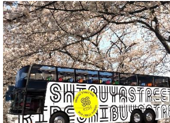
オープントップバス (イメージ)